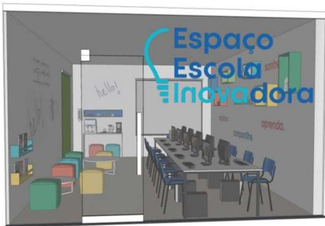
Figura 1 – Vista externa do Espaço Escola Inovadora