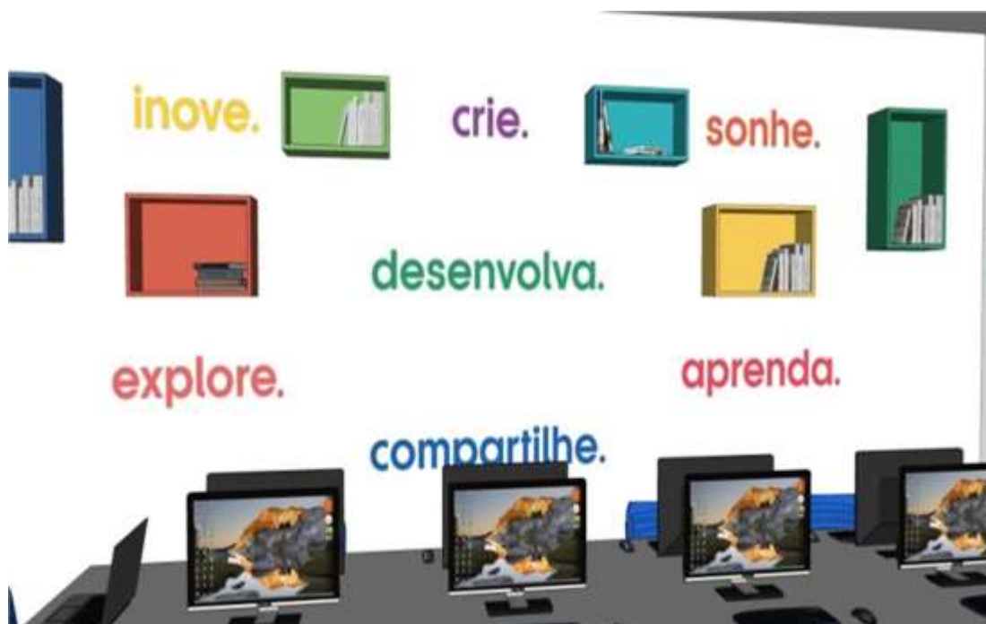
Figura 3 – Vista Interna – Parede Lateral com aplicação de adesivo