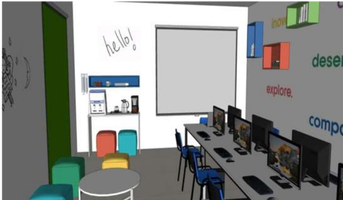
Figura 4 – Vista Interna – Área dos Computadores e Espaço Lounge