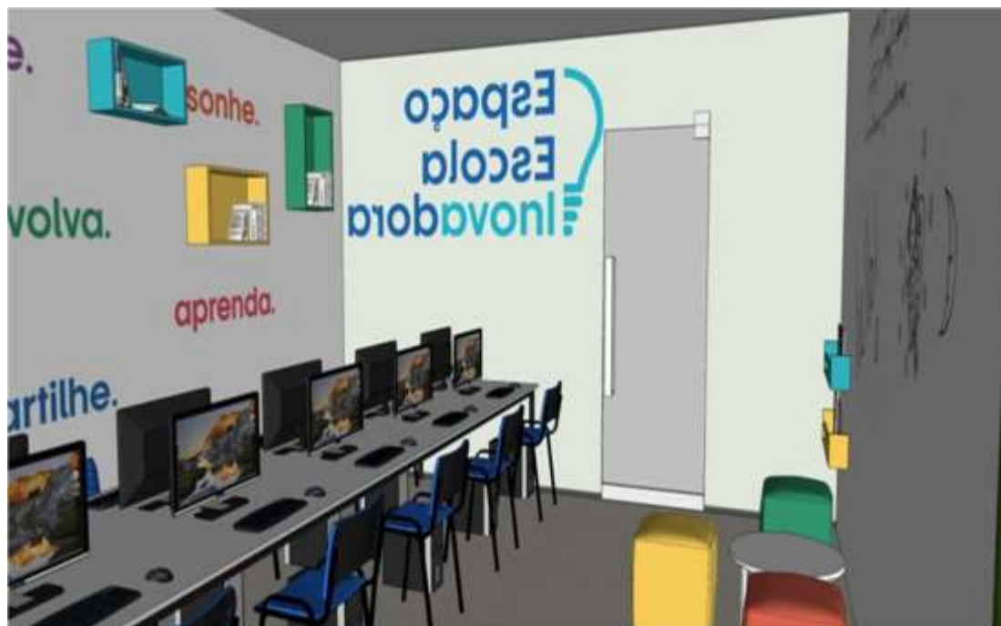
Figura 2 – Vista Interna do Espaço Escola Inovadora