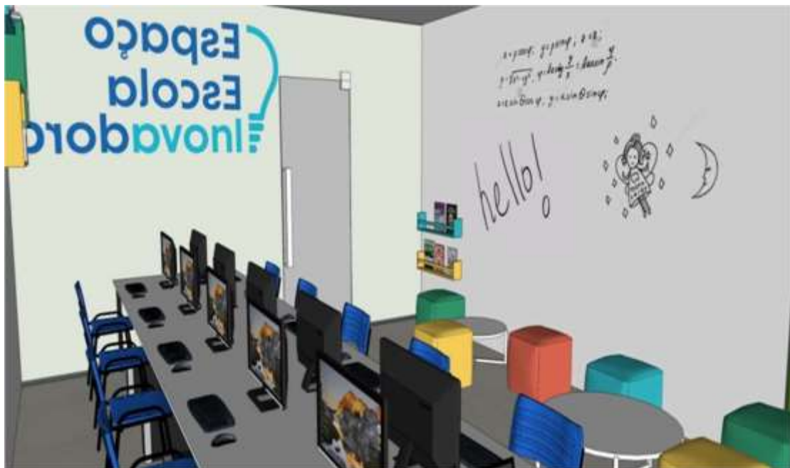
Figura 5 – Vista Interna – Área dos Computadores e Espaço Lounge